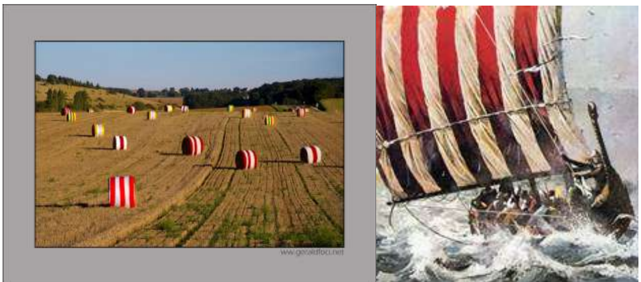
Expérience-test réalisée en septembre 2010 dans un champ de Buhy (Val d'Oise) le long de la RN14 (descriptions, photos à consulter sur pièce jointe à ce dossier)

L'impact visuel sera important, esthétique, interpellant efficacement tous les usagers routiers de la région, sera photographié et transmis par tous avec leurs outils de communications sociales personnelles. Des photographes professionnels nous conserveront des archives de qualité. (Concours photos). Utile, la participation de nombreux bénévoles (jeunes et adultes). Ces volontaires issus d'organismes sociaux, d'associations locales et des territoires urbains seront accueillis avec générosité par l'organisateur et les cultivateurs ; la création de liens et rencontres avec le monde agricole en une action « art contemporain » moderne en leur Pays du Vexin.